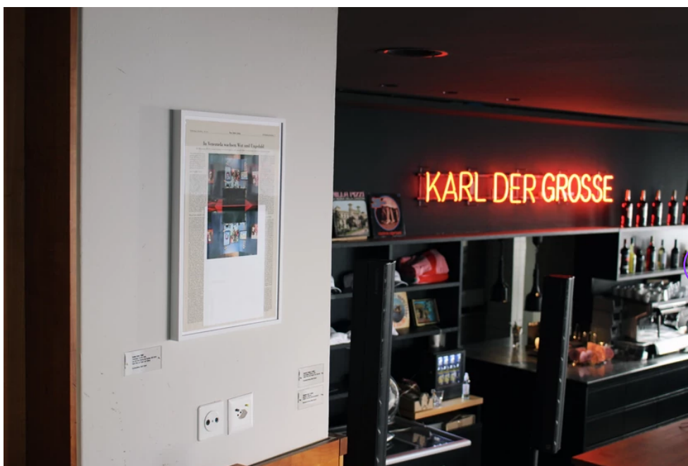
Kunstaussstellung «It's a womens, women's, women's World» im Zürcher Debattierhaus Karl der Grosse.

Im Fokus von Meier-Bickels Ausstellung stehen ausschliesslich Künstlerinnen, was auch zur Location passt: Der 1894 gegründete Frauenverein traf sich nämlich des Öfteren im Debattierhaus, es wurde dann zu ihrem Stammlokal. Boleromagazin.ch hat die Zürcherin im Karl der Grosse getroffen und mit ihr über die Stellung von Frauen in der Kunstwelt gesprochen.