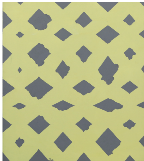
Pierre Haubensak: Ling (Pochoir), 1997 Acryl auf Leinwand, 70 x 60 cm

Manon hat mit ihrer Kunst nachhaltig gewirkt und vieles vorweg genommen, was heute aktuell ist. Manons Einzelausstellung Reise nach Sibirien (2015) gehört bis heute zu den eindrücklichsten Ausstellungen im Kunsthhaus Interlaken.