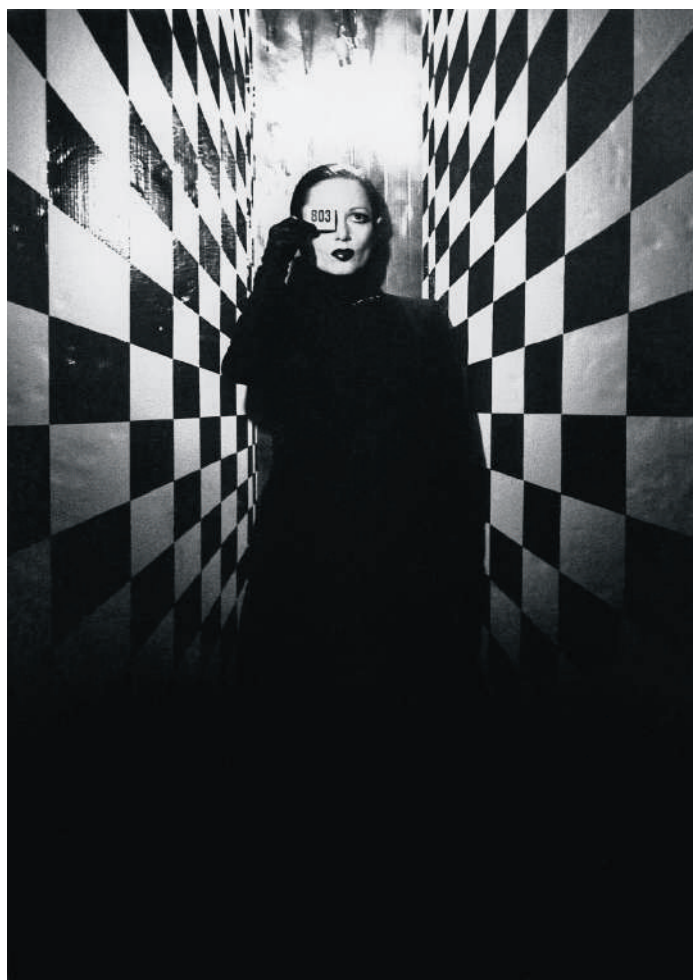
Img 7 : Manon, Elektrokardiogramm 303/304 , série photographique, 1979.

Léopoldine Turbat lturbat@ccs-paris.com T+33 (0)1 88 21 04 21