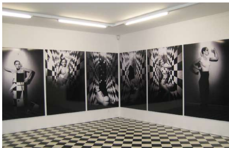
Img 6 : Manon, Elektrokardiogramm 303/304 , série photographique, 1979.