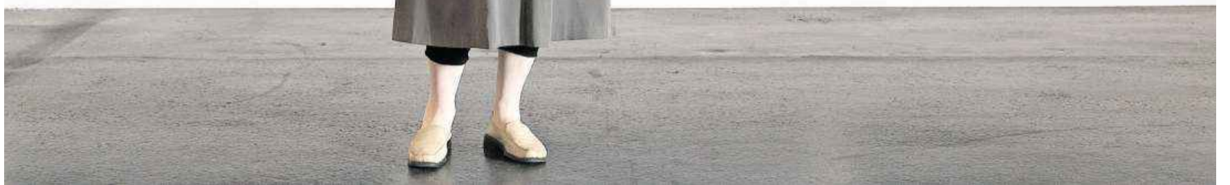
Bereits 2011 zeigte Manon im Aargau Bilder aus der Reihe «Hotel Dolores», damals im Aargauer Kunsthaus.

Bild: Alex Spichale (Aarau, 25. Januar 2011)