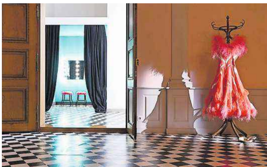
Das Ballkleid und die Künstlergarderobe aus «Lachgas».

Bild: Alex Spichale (Aarau, 25. Januar 2011)