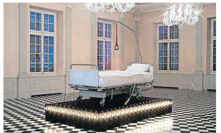
Manons «Lachgas» im Kunsthaus Zofingen.